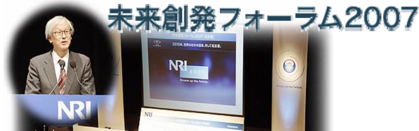
未来創発フォーラム2007を名古屋

Dream up the Future 2007 Tokyo (held October 29, 2007) Osaka (held October 10, 2007) Nagoya (held October 19, 2007)