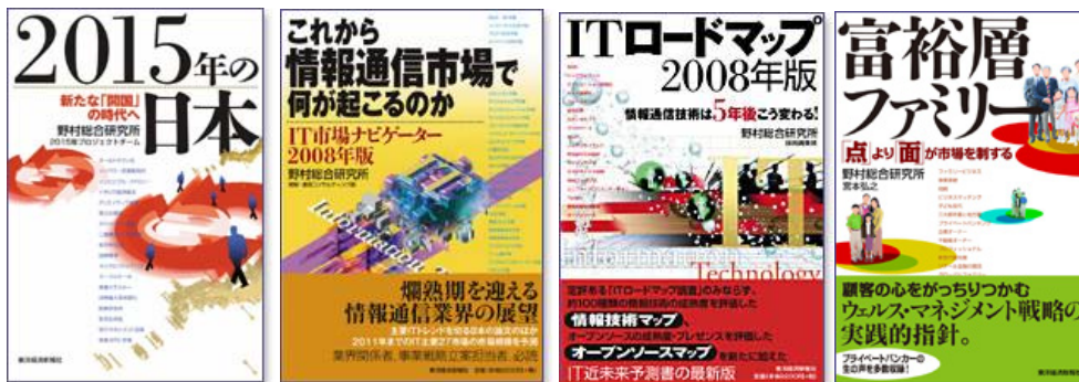
Published by Toyo Keizai Inc.